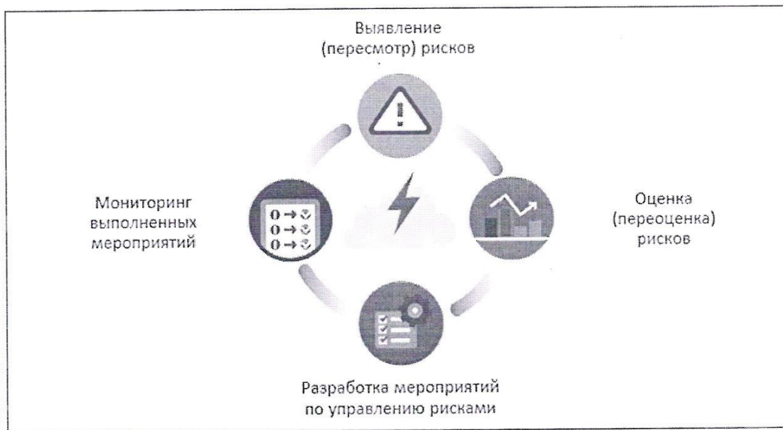
Рис.1. Схема управления профессиональными рисками

После сопоставления результатов обследования с базовым перечнем (классификатором) опасностей комиссия составляет перечень идентифицированных опасностей и оцененных рисков на рабочем месте (профессии, должности).