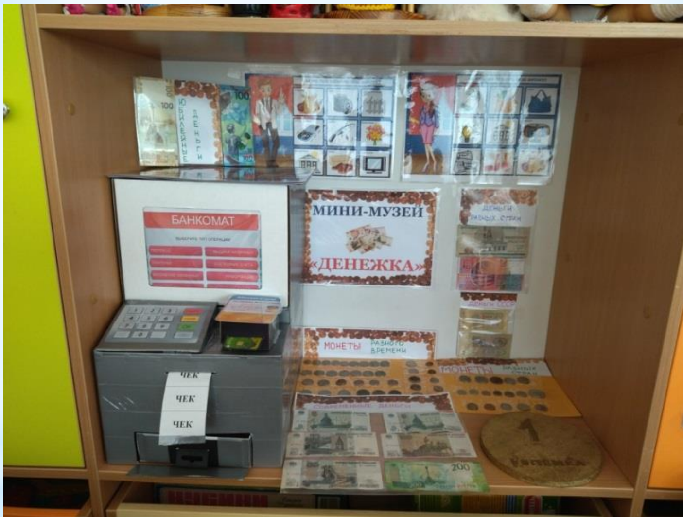
* Мини музей «Денежка»