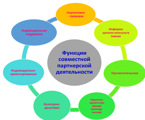
Рисунок 1. Модель включенности родителей в образовательный процесс МАДОУ детский сад № 34.

Проектирование деятельности по обеспечению включенности родителей в образовательный процесс осуществляется на основе следующей модели (рисунок 1):