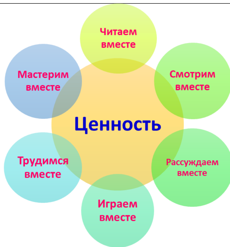
Рисунок 5. Формат совместной деятельности в МАДОУ детский сад № 34.