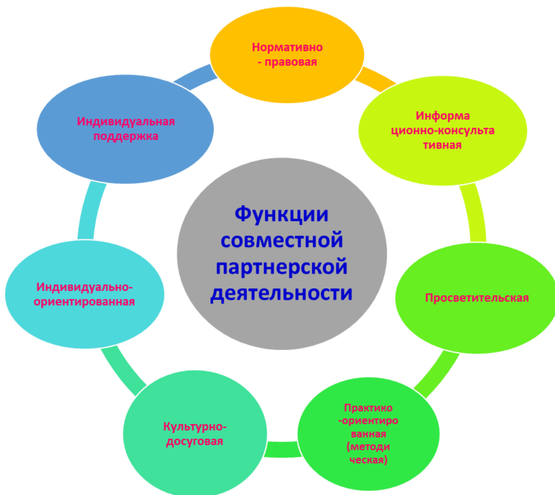
Рисунок 1. Модель включенности родителей в образовательный процесс МАДОУ детский сад № 34.

Проектирование деятельности по обеспечению включенности родителей в образовательный процесс осуществляется на основе следующей модели (рисунок 1):