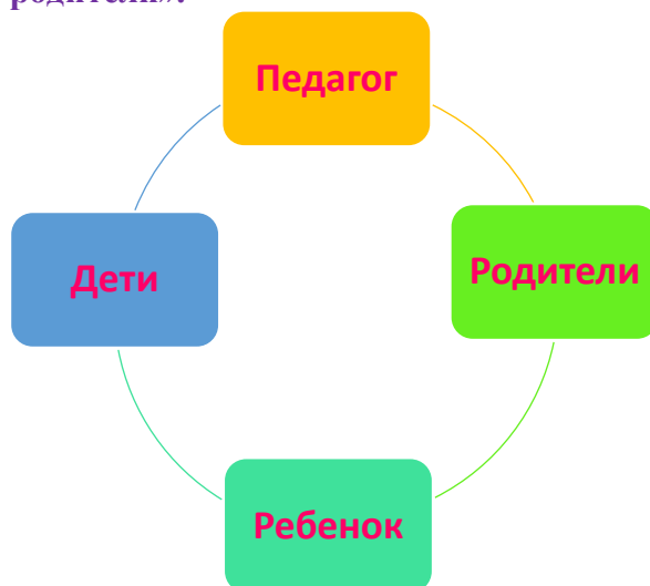
Рисунок 4. Система взаимодействия участников воспитательного процесса.