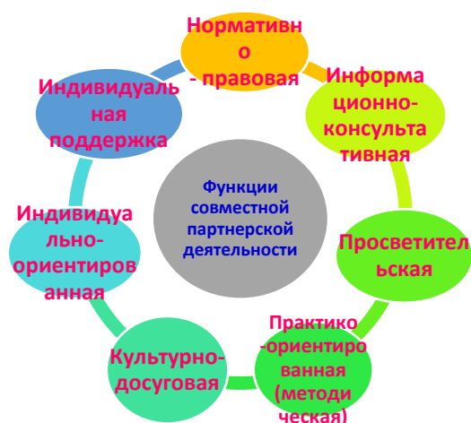
Рисунок 1. Модель включенности родителей в образовательный процесс МАДОУ детский сад № 34.