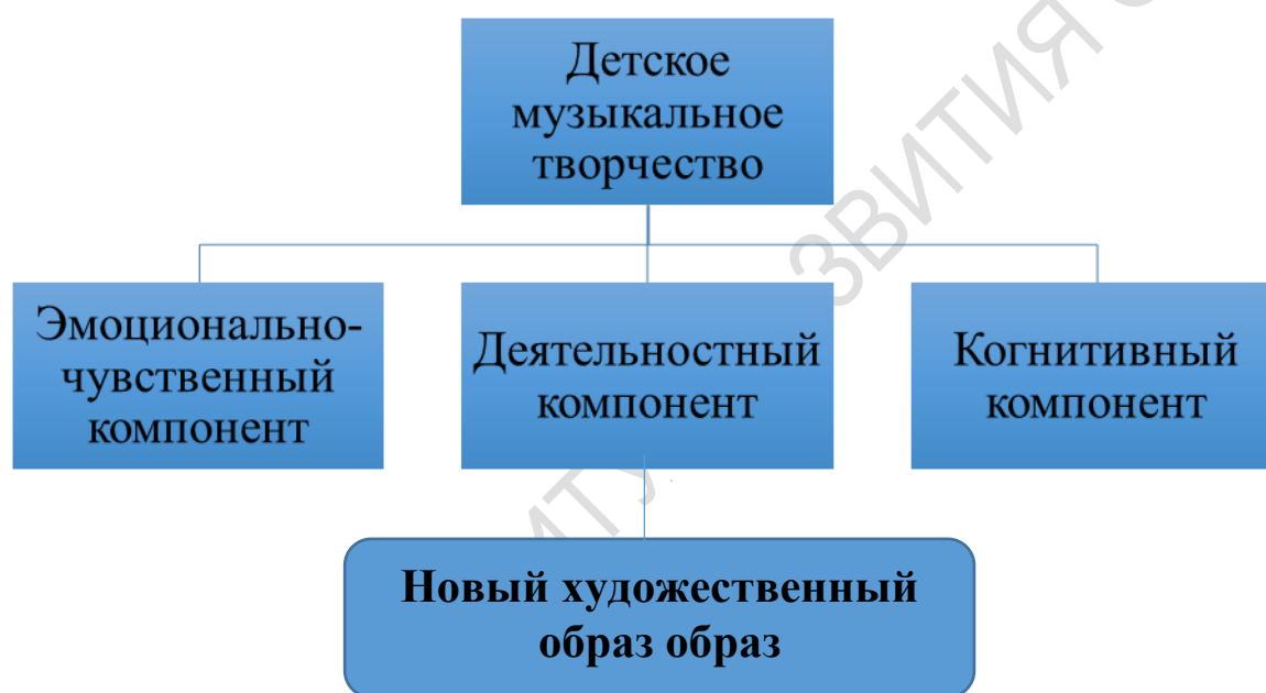
Рисунок 1. Структура культурной практики детского музыкального творчества

Таким образом, в структуре культурной практики детского музыкального творчества выделяется три компонента, которые представлены на рисунке 1.