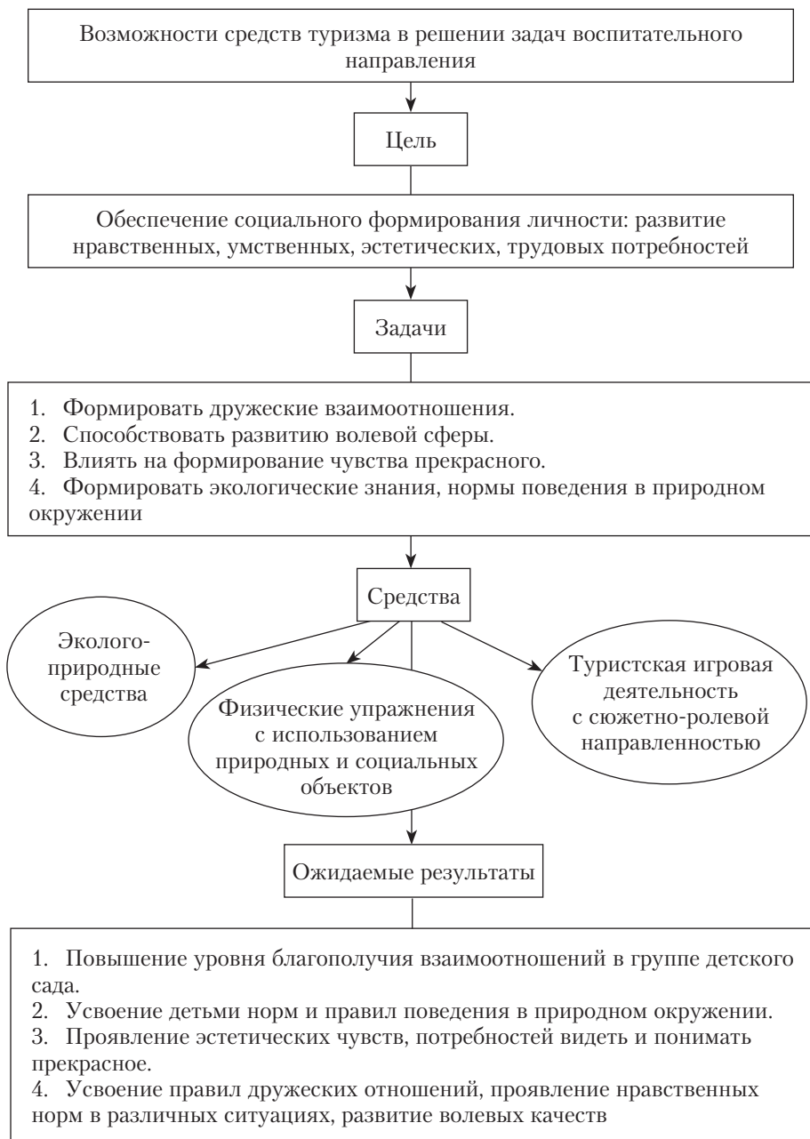
Рис. 1.4. Средства туризма в решении воспитательных задач

В результате научных исследований выявлено, что организованная совместная деятельность оказывает существенное влияние на характер взаимоотношений детей, при этом популярность ребенка в группе зависит от успеха, которого он достиг в совместной деятельности.