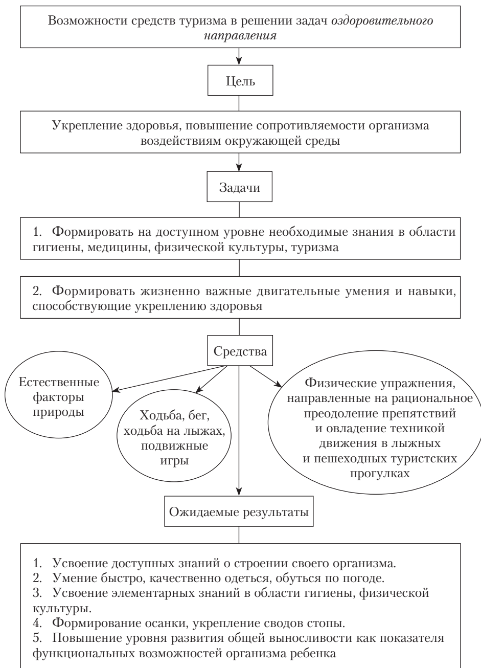
Рис. 1.2. Средства туризма в решении оздоровительных задач

вошло в педагогическую литературу как «эколого-туристская работа». Под содержанием этих терминов для детей дошкольного возраста понимается прежде всего игровая деятельность, основанная на краеведческом принципе, в процессе которой формируются экологические знания и нормы поведения человека в природном окружении.