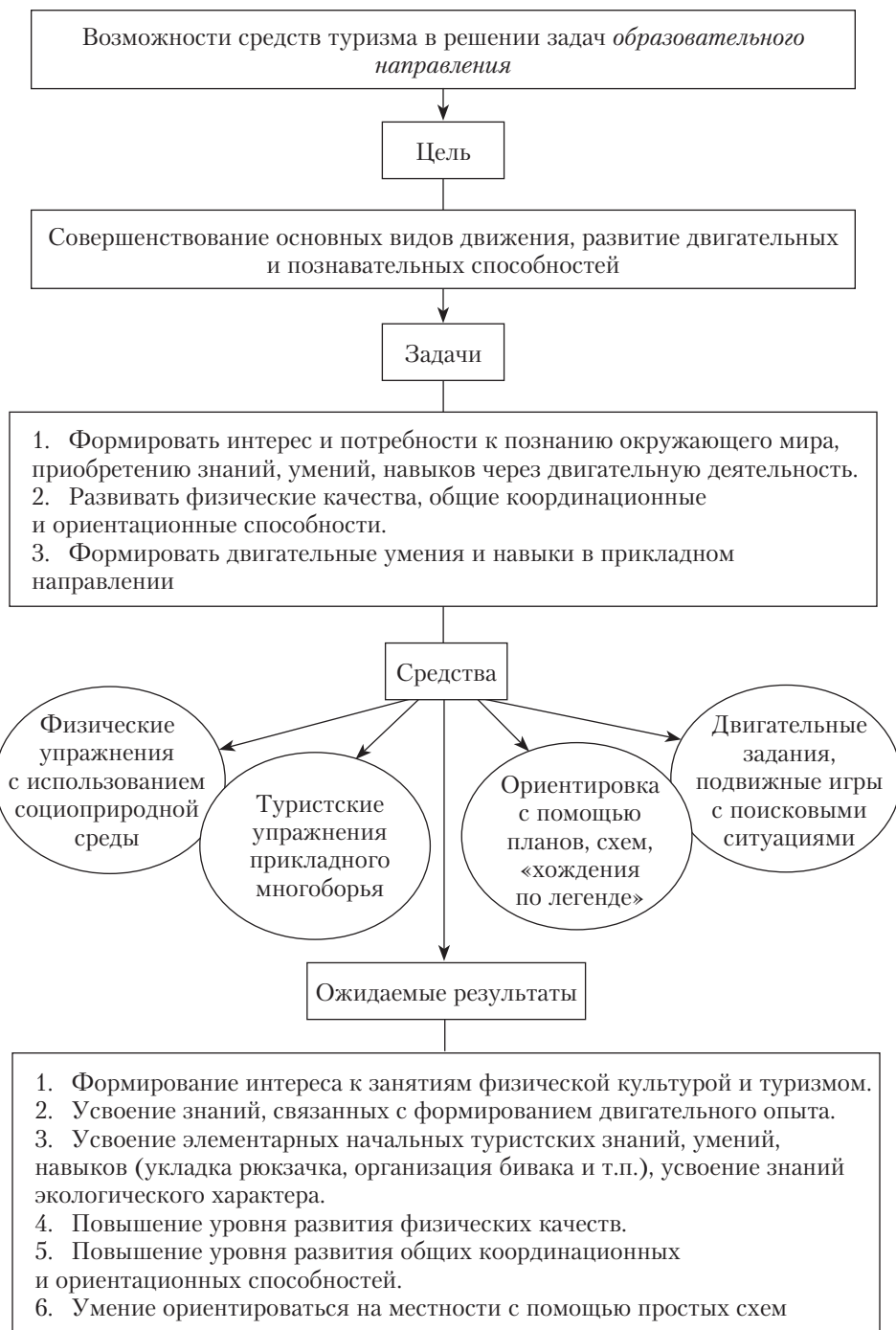
Рис. 1.3. Средства туризма в решении образовательных задач

развития ориентационных способностей, считает автор, являются подвижные игры на воздухе с преодолением различных препятствий, а также выполнение специально подобранных заданий (рис. 1.3).