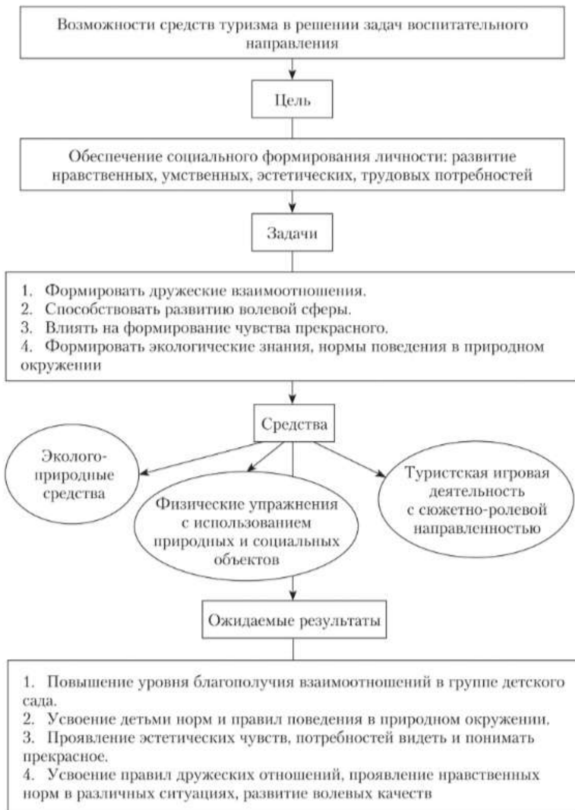
Рис. 1.4. Средства туризма в решении воспитательных задач

В результате научных исследований выявлено, что организованная совместная деятельность оказывает существенное влияние на характер взаимоотношений детей, при этом популярность ребенка в группе зависит от успеха, которого он достиг в совместной деятельности.