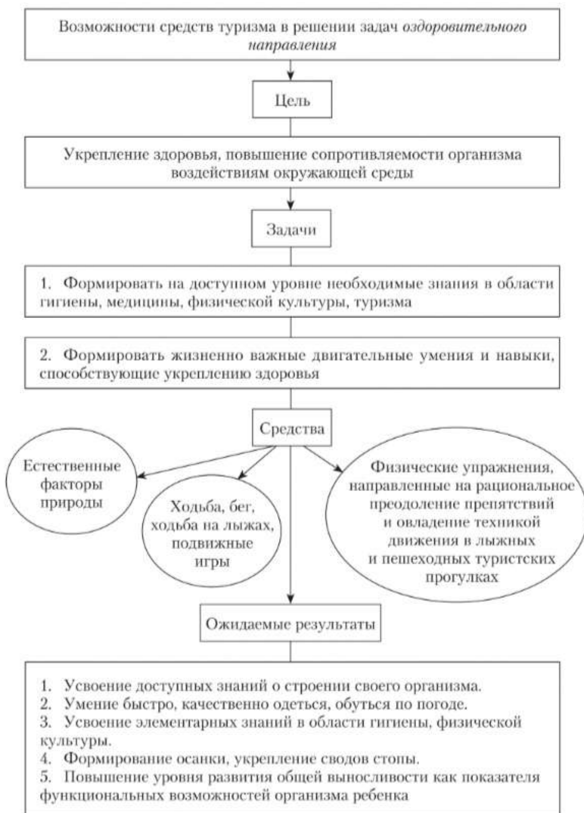
Рис. 1.2. Средства туризма в решении оздоровительных задач

вошло в педагогическую литературу как «эколого-туристская работа». Под содержанием этих терминов для детей дошкольного возраста понимается прежде всего игровая деятельность, основанная на краеведческом принципе, в процессе которой формируются экологические знания и нормы поведения человека в природном окружении.