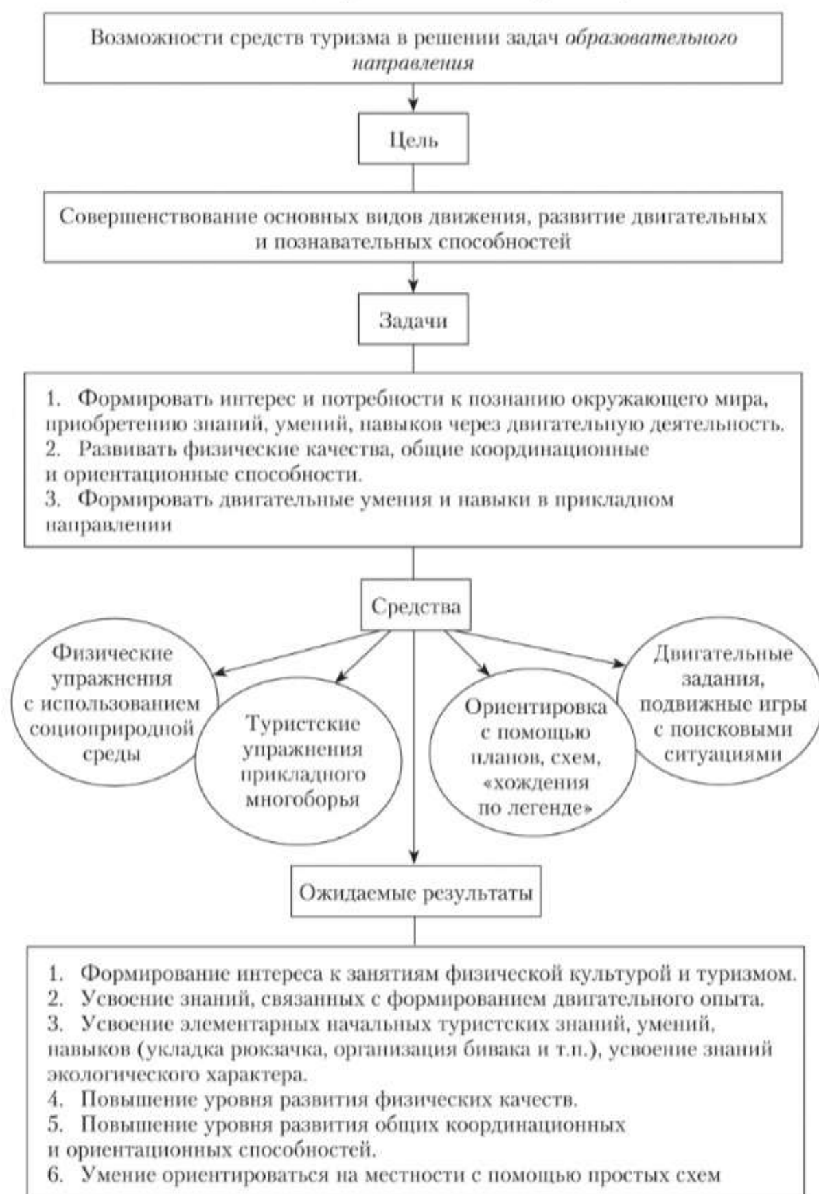
Рис. 1.3. Средства туризма в решении образовательных задач

развития ориентационных способностей, считает автор, являются подвижные игры на воздухе с преодолением различных препятствий, а также выполнение специально подобранных заданий (рис. 1.3).