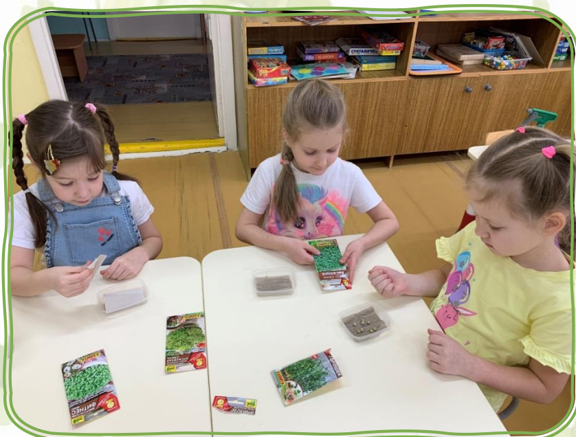
Знакомство с семенами