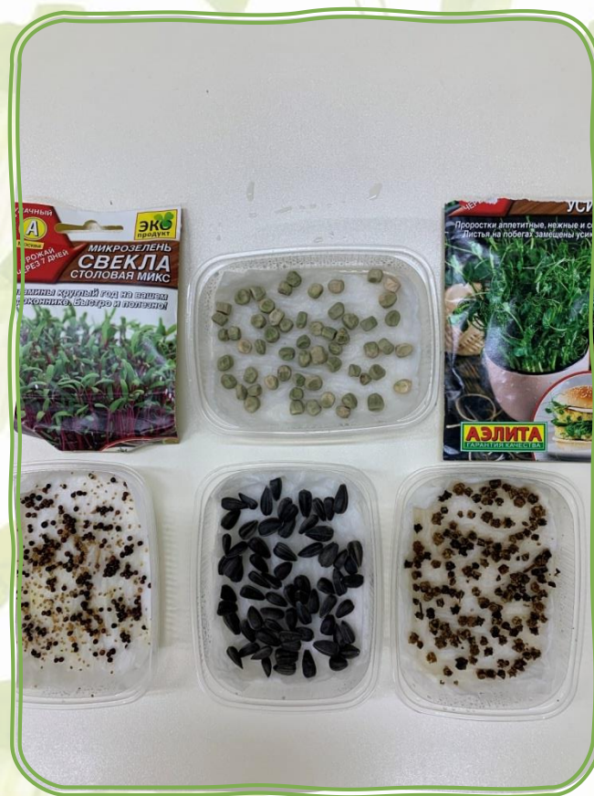
Выбрали семена свеклы, петрушки, салата и гороха