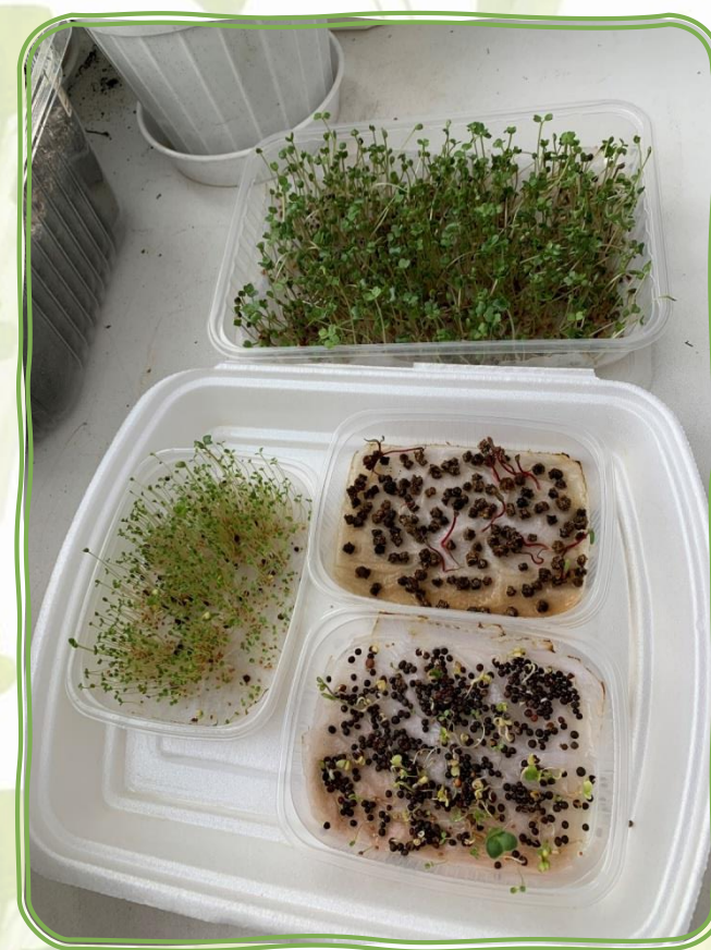
Почвой для растений послужили бумажные салфетки