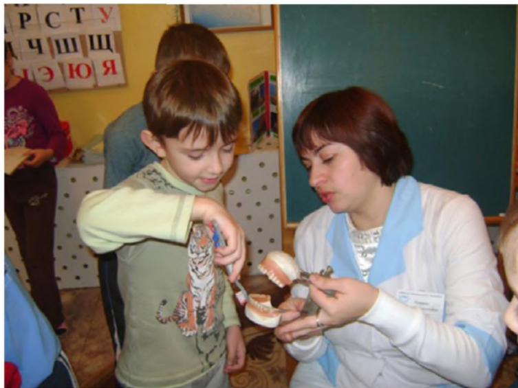
Беседа с врачом-стоматологом