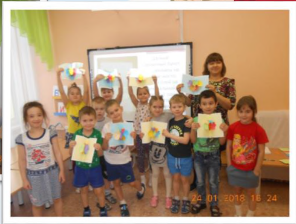
Мастер-класс по оригами