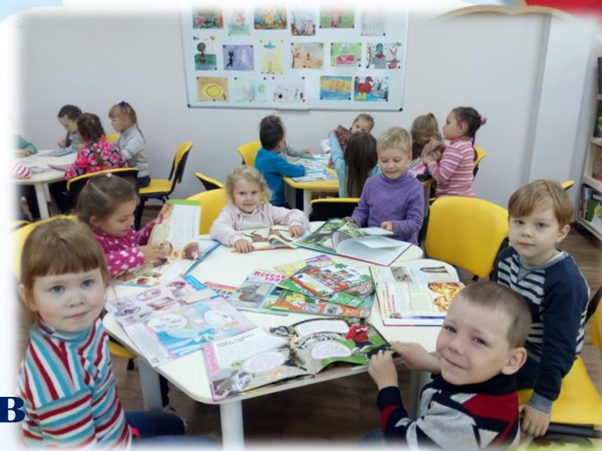
Детская библиотека им С.Маршакa