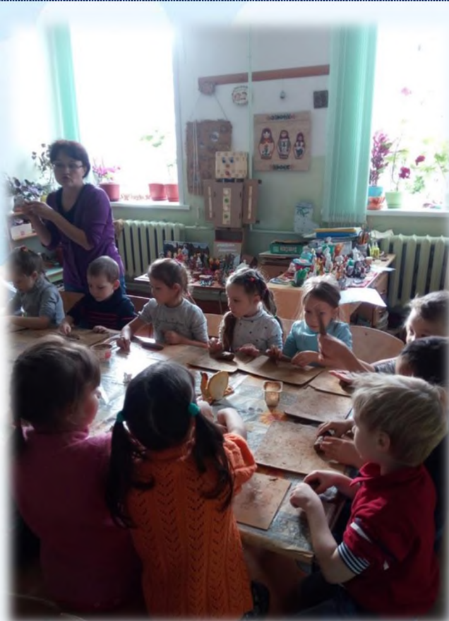
Станция юных техников